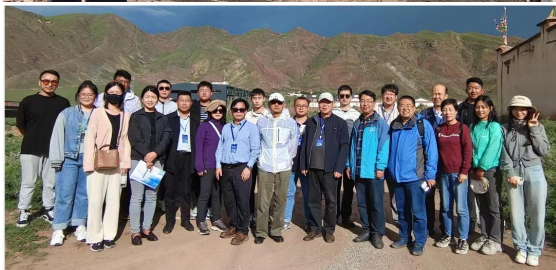
赴林周科技小院调研