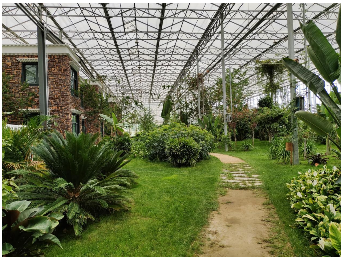
赴蒙草集团藏草生态公司调研