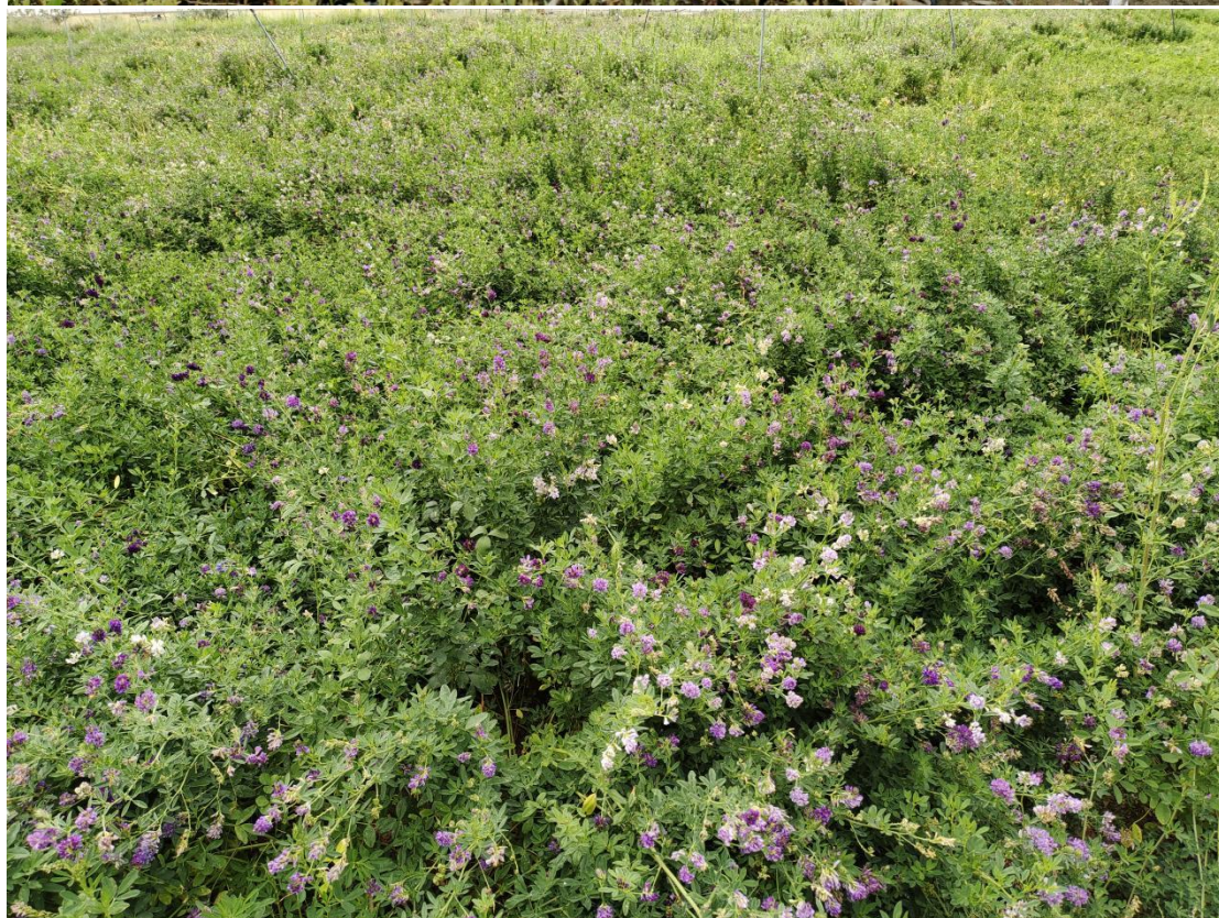
赴西藏江平农业公司调研