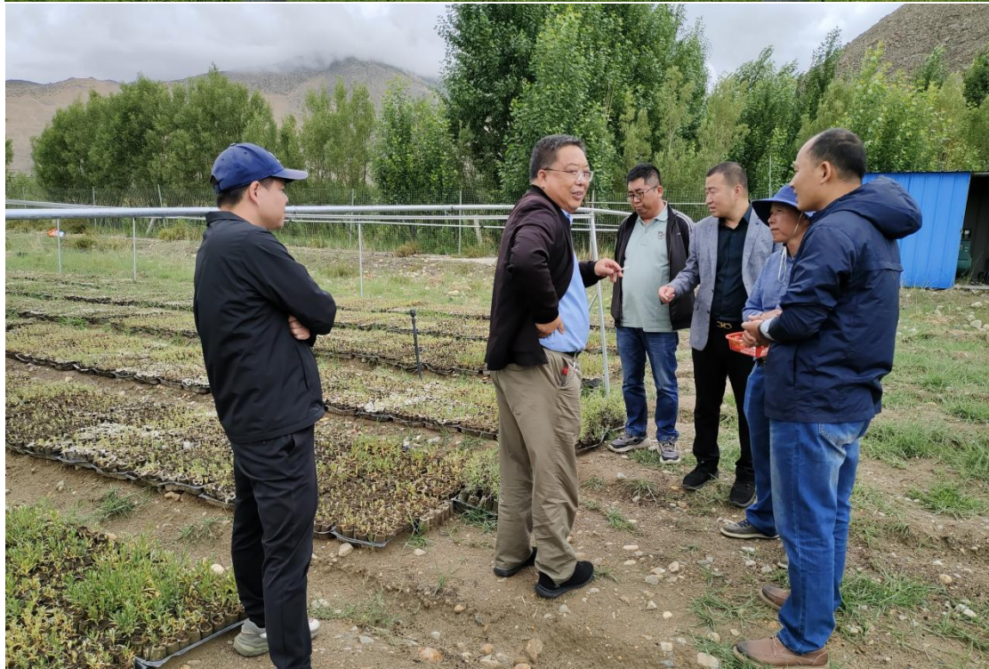
赴西藏江平农业公司调研