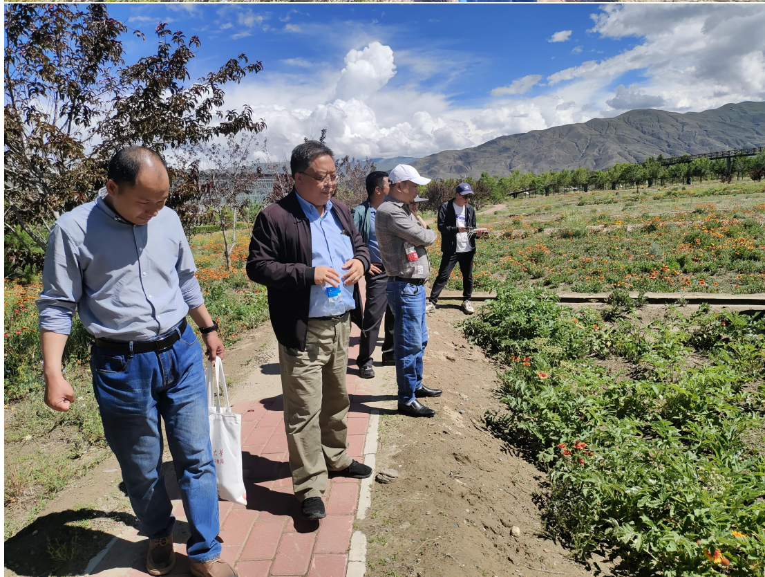
赴蒙草集团藏草生态公司调研