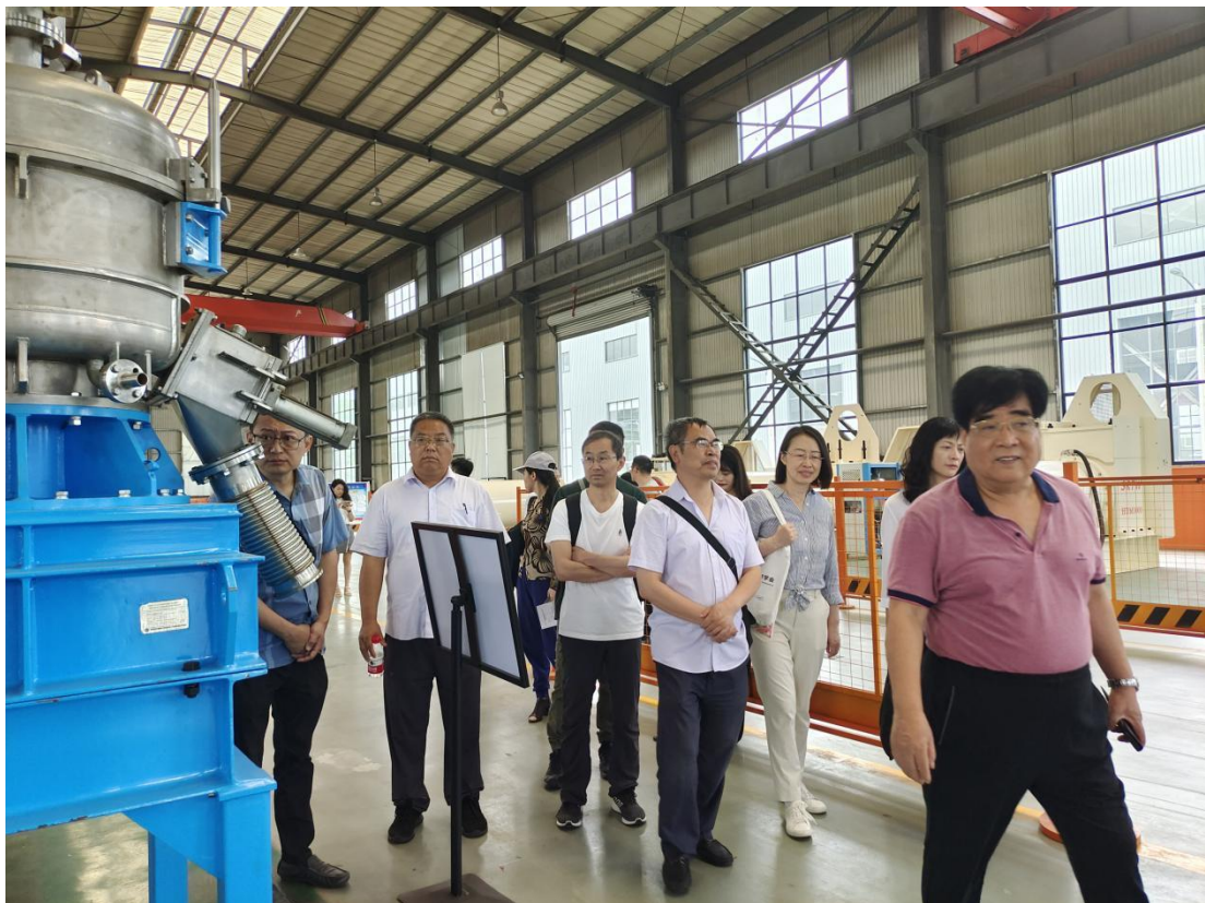
赴四川瑞驰拓维机械制造有限公司调研