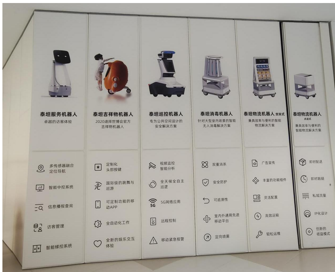
赴德阳光控特斯联 AI CITY 项目调研