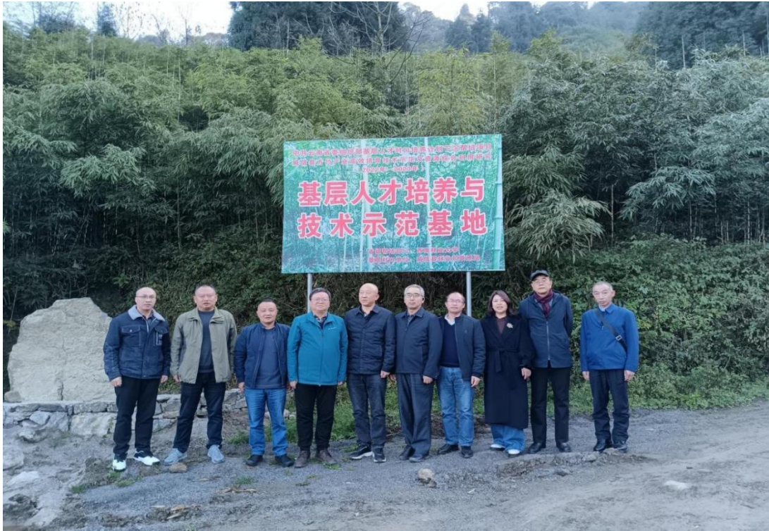
图：实地考察调研威信县方竹生态高效培育示范基地