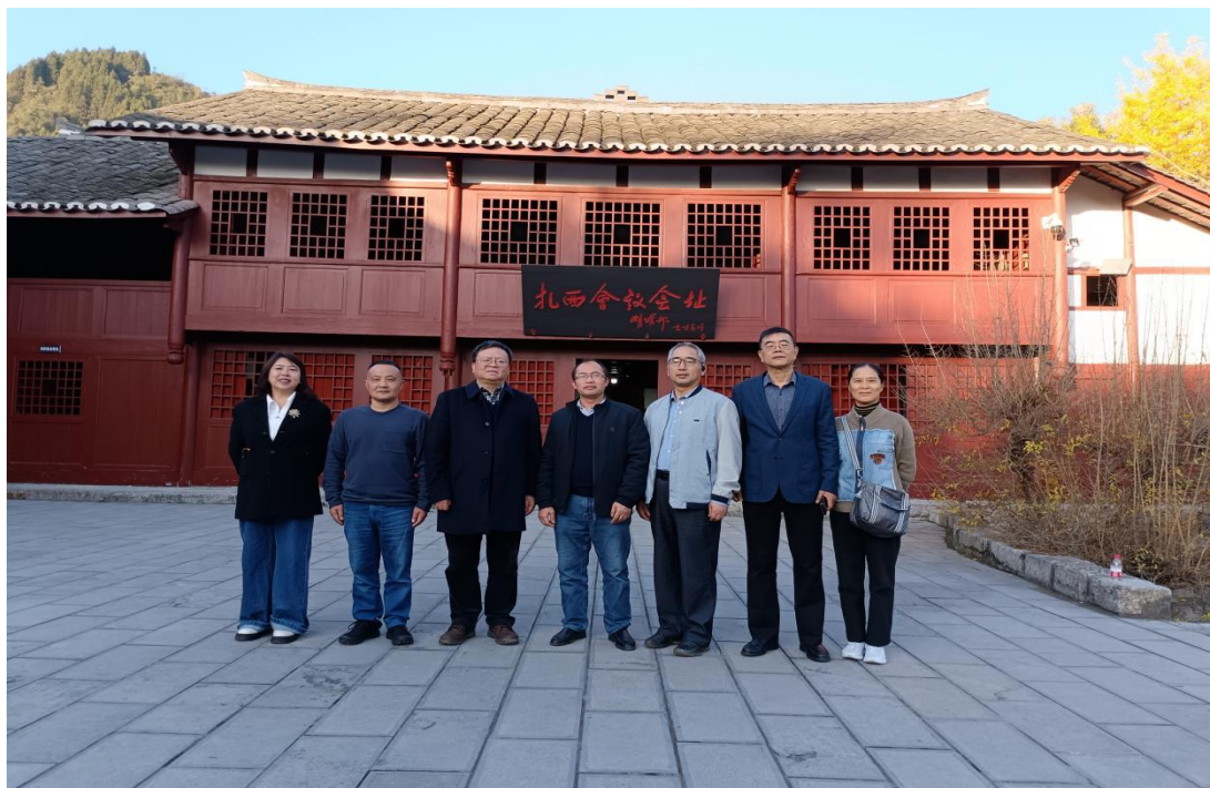
图：深入扎西会议会址接受革命传统教育