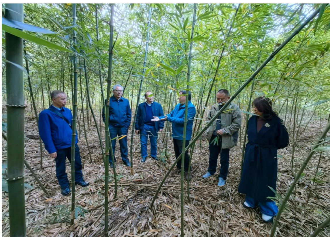
图：实地考察调研威信县方竹生态高效培育示范基地

紧围绕云南省委、省政府提出的“3815”战略发展目标和昭通市委、市政府深入实施“六大战略”、扎实做好“产、城、人”三篇文章部署要求，聚焦“扩红、增绿、育人、兴城、富民”五张时代答卷，将方竹作为全县主导产业进行精心谋划、重点打造，累计种植方竹 36.2 万亩，全县各类竹资源总面积已达 54.2 万亩。