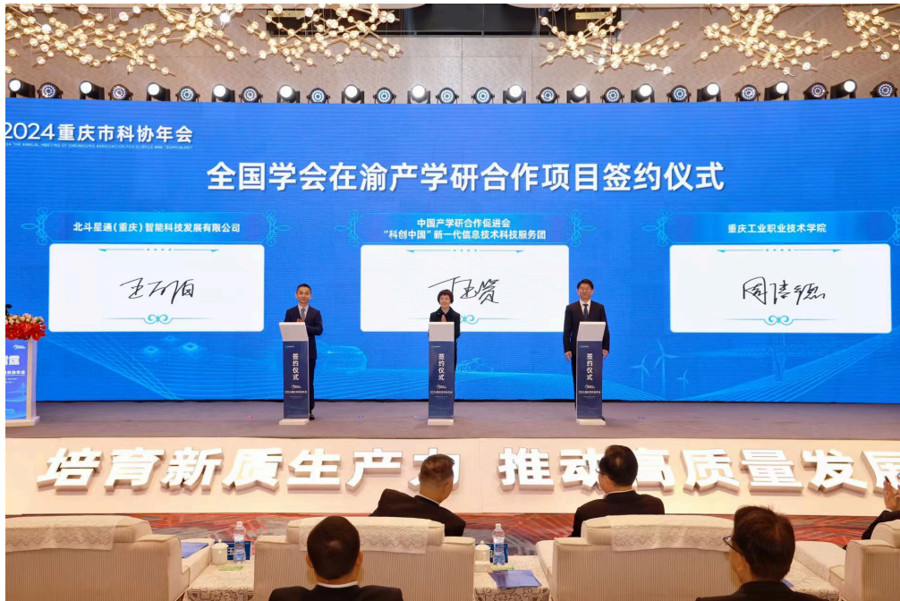
▲2024重庆市科协年会现场。

据了解，学会是党和政府团结联系广大科技工作者的桥梁纽带，具有团结人才、服务人才的组织优势，是国家创新体系的重要组成部分。近年来，全国学会充分发挥自身优势，在加强科技工作者联系服务、推动创新驱动发展、提高全民科学素质、服务党和政府科学决策等方面做了许多富有成效的工作。