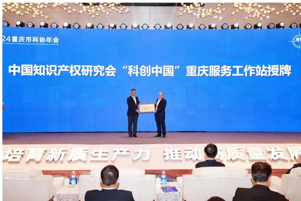
▲2024重庆市科协年会现场。

据悉，本次年会由市科协和渝北区政府共同主办，以“培育新质生产力·推动高质量发展”为主题，聚焦新一代电子信息、智能网联新能源汽车、航空航天等领域，打造助力成渝地区双城经济圈建设的科技交流平台。