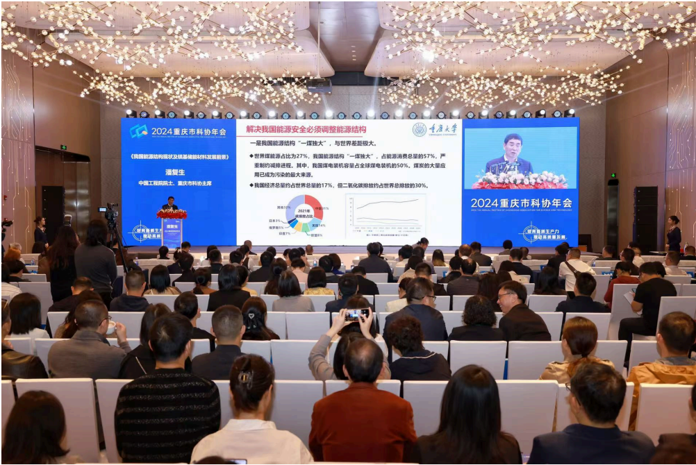
▲2024重庆市科协年会现场。吴玥瞳 摄